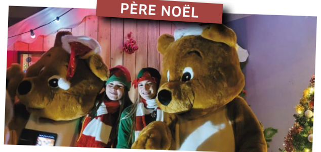
Le Père Noël accompagné des ours O'Rel et Delphy et des lutines ont distribué des friandises à plus de 200 enfants.