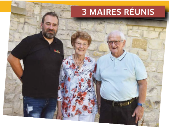
Lors de la journée nature, et pendant le repas du comité des fêtes, les trois maires ont posé pour une photo réunissant 31 ans de bonne gestion.