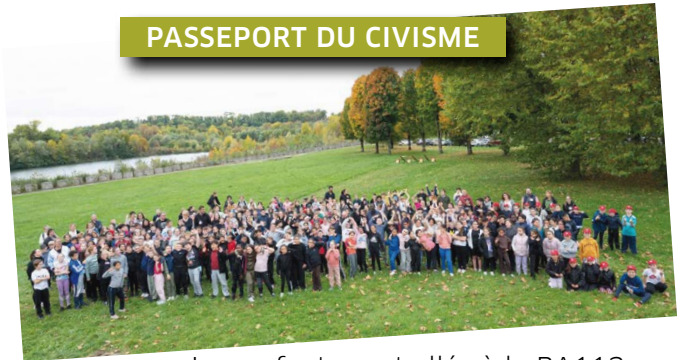
Les enfants sont allés à la BA113, avec ceux de Saint-Dizier, pour une journée « militaire ».