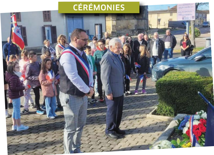
Le 11 novembre, toujours aussi suivi, fut marqué par deux cérémonies d'hommage. à l'ancien cimetière d'abord où un hommage aux poilus fut rendu, puis au Monument aux Morts, avec les enfants du Passeport du civisme, et la jeune porte drapeau.